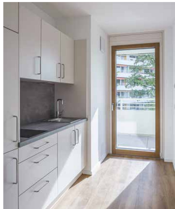
LINKS Sehr kompakt: Küchenblock mit Zugang zum Balkon