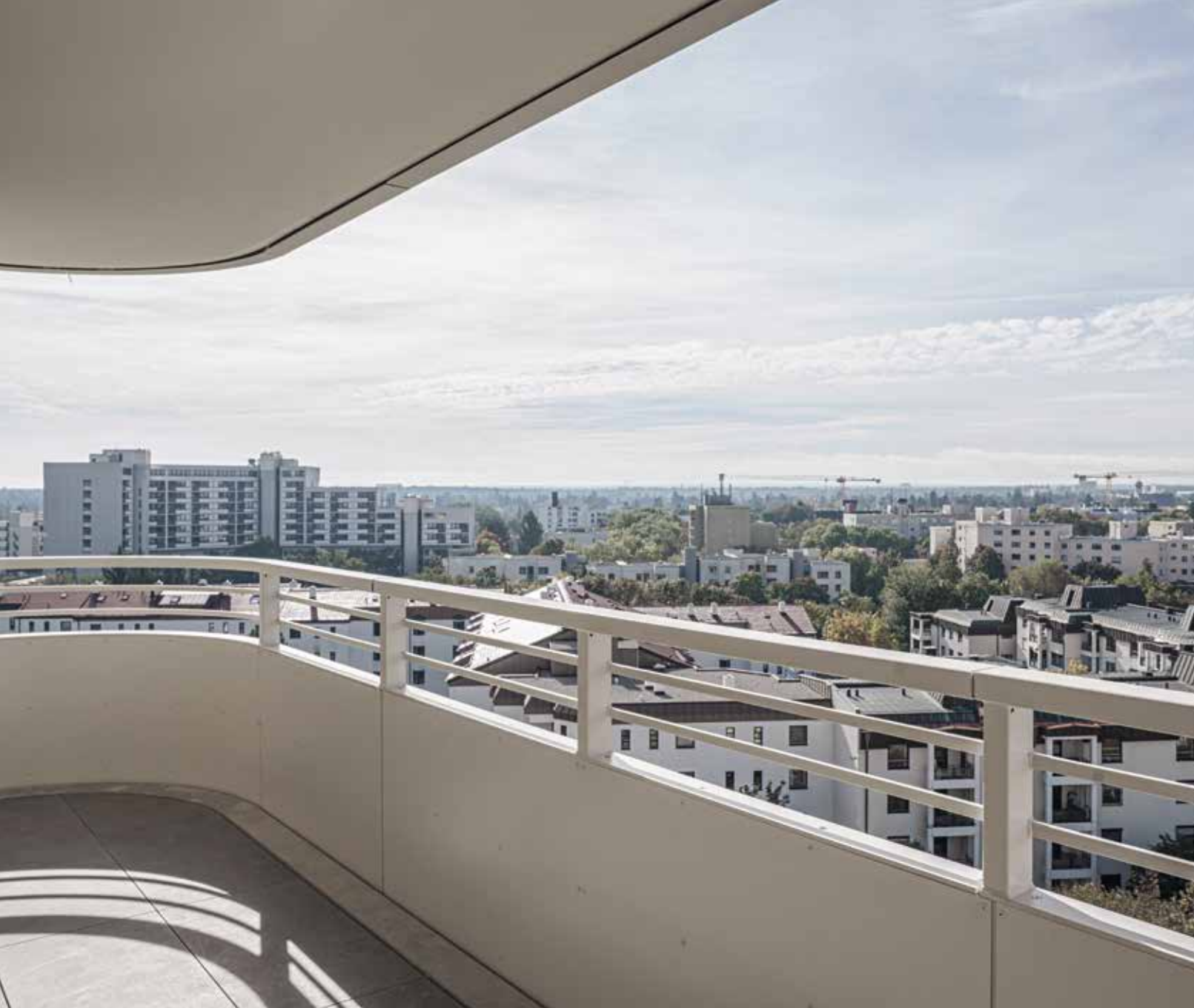
Beschwingter Ausblick über Münchens Westen

W ährend viele Hochhäuser in-zwischen als unökologisch und untypisch gelten – München hat seine ganz eigene, jahrzehntelang erbittert geführte Auseinandersetzung mit diesem Gebäudetyp – zeigt das neue, 40 Meter hohe Wohnhochhaus des Münchner Augustinum, dass es auch anders geht: Seine polygonale Silhouette antwortet auf die Erfordernisse des Ortes, bietet Schallschutz vor der nahegelegenen Autobahn A96 nach Lindau, sorgt für eine gute Orientierung der Wohnungen und fügt sich trotz seiner Dimensionen in die bestehende Anlage im Westen der Landeshauptstadt ein. Zwischen Turm und dem – aus