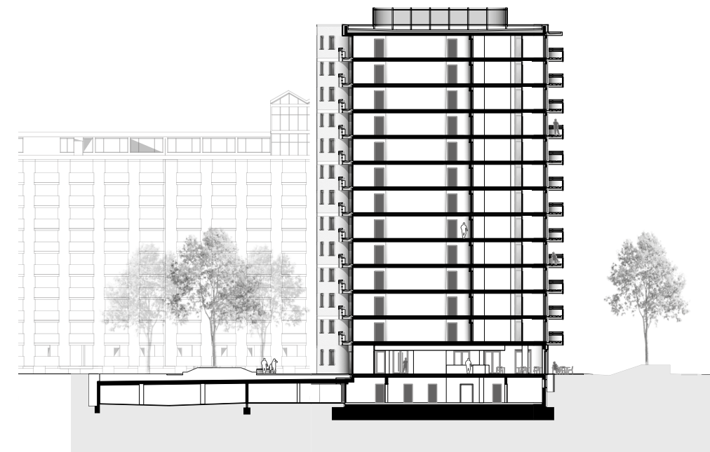
Maßstab M 1:600